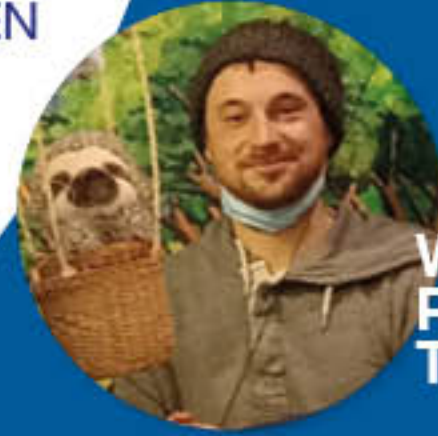
WILLIS PUPPEN- THEATER

90 STÄNDE MIT BUNTEM PROGRAMM INFOS VON SCHULEN, VEREINEN UND FIRMEN SPORTVORFÜHRUNGEN FEUERWEHR ZUM ANFASSEN KINDERPROGRAMM FOODTRUCKS & BARS KAFFEE & KUCHEN GEWINNSPIELE